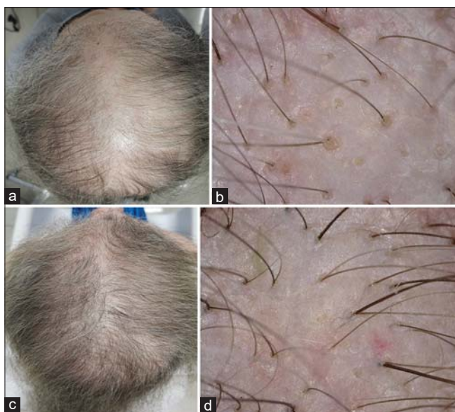
Figure 1 (a-d): Obraz makroskopowy i trichoskopowy łysienia w przebiegu SARS-CoV-2. Pacjentka zgłosiła się do gabinetu trychologicznego z objawem intensywnego, nadmiernego wypadania włosów. W wywiadzie pojawiła się potwierdzona infekcja SARS-CoV-2, której przebieg pacjentka opisała jako umiarkowany, bez hospitalizacji. Objaw nadmiernego wypadania włosów pojawił się około 1,5 miesiąca od pierwszych objawów infekcji i trwał z dużą intensywnością około 2 miesiące, dając w obrazie makroskopowym oraz trichoskopowym cechy znacznego przerzedzenia włosów. Obraz makroskopowy i trichoskopowy pacjentki po 4 miesiącach od pojawienia się objawów nadmiernego wypadania włosów. Stabilizacja wypadania nastąpiła po około 2 miesiącach od jego pojawienia się, a odrost włosów anagenowych zauważalny był już po około miesiącu od pierwszych objawów.

przestaje rosnąć. Zatrzymanie wzrostu włosów skutkuje ich wypadaniem. O ustalenie przyczyny wystąpienia łysienia telogenowego jest trudno, gdyż niezbędny jest do tego holistyczny obraz funkcjonowania organizmu. Jeszcze trudniej jest powiązać wypadanie włosów z przebytą infekcją SARS-CoV-2, również z uwagi na to, że wypadanie włosów może rozpocząć się nawet po czterech miesiącach od wystąpienia czynnika wyzwalającego (np. choroby) [11]. Czynniki, które mogą wzmacniać tendencję do telogenowego wypadania włosów, są m.in. [12]: