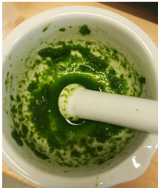
Fot. 2. Rozdrobniony liść żyworódki pierzastej

Właściwości przeciwutleniające związków chemicznych są istotne nie tylko w obszarze dermatologii i działania anti-aging . Ochrona komórek przed szkodliwymi reaktywnymi formami tlenu ma znaczenie w przypadku leczeniu zaburzeń układu sercowo-naczyniowego, układu moczowego czy chorób wątroby [1].